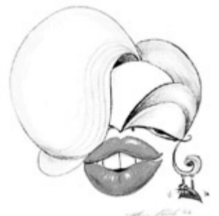
Marilyn Monroe Caricature: Balaban

Vom 5. bis zum 31. Mai stellt der rumänische Künstler Florin Balaban seine Karikaturen im Rittersaal des Viandener Schlosses aus. Zu sehen sind Cartoons von bekannten Politikern, Schauspielern oder sonstigen Persönlichkeiten.