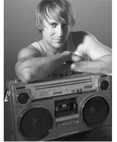
DJ David Guetta